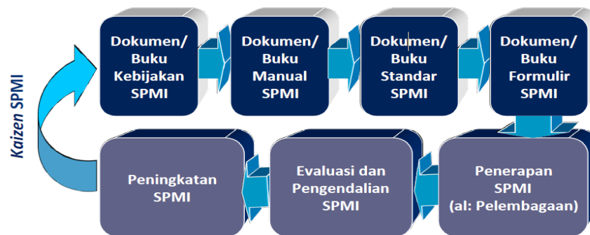
Gambar 1. Siklus Pengendalian dan Peningkatan Standar Mutu

Ketiga hal ini bersifat siklus (Gambar 1) dan dilakukan secara berkesinambungan dan konsisten. Siklus-siklus ini pada akhirnya akan mewujudkan konsep Kaizen (perbaikan dan peningkatan berkelanjutan).